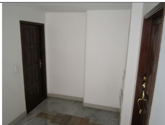
Foto 4. Puerta de acceso al apartamento de la sociedad comercial.