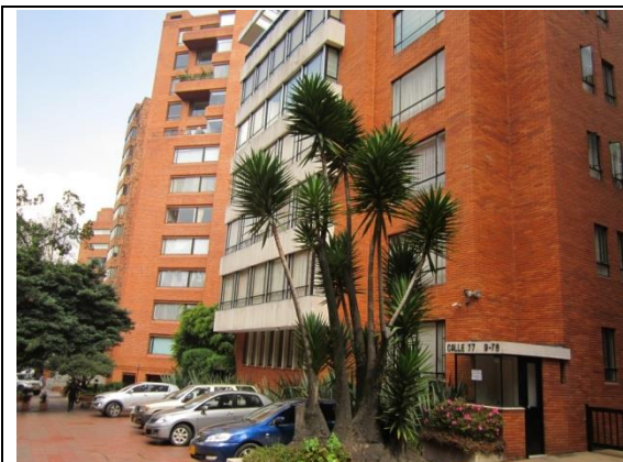
Foto 1. Fachada del edificio donde se ubica la sede de la sociedad comercial.