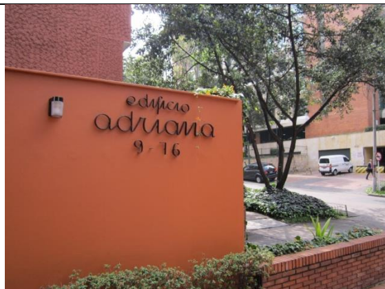
Foto 2. Placa del nombre y de la nomenclatura del edificio.