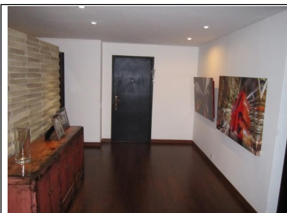
Foto 5. Vista interior del apartamento hacia la puerta de ingreso.