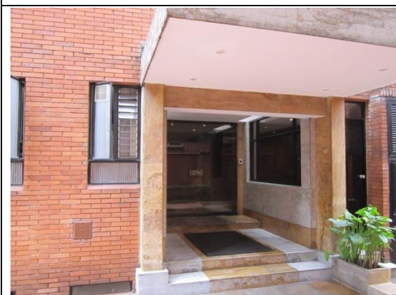
Foto 3. Portería de acceso al edificio.